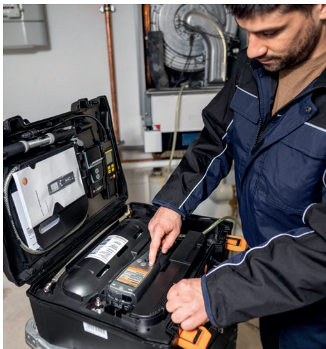
Automatische Gebrauchsfähigkeitsprüfung mit Einspeisevorrichtung mit Anschluss an die Gastherme